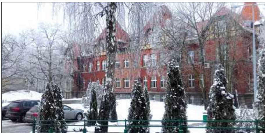
Budynek dawnego Publicznego Szpitala Miejskiego w Krotoszynie, w zimowej odśnie. Zdjęcie współczesne.

Na obecnym etapie analizy dokumentów historycznych dotyczących Publicznego Szpitala Miejskiego w Krotoszynie i Publicznego Szpitala Powiatowego w Koźminie możliwe jest porównanie danych dotyczących statystyki leczenia chorych w latach 1929-1931. Jest to możliwe dzięki dostępowi do bliźniaczych dokumentów zrehabilitowanych w dwóch szpitalach, w tym samym okresie. W artykule zaprezentowano skany dokumentów z Archiwum Państwowego w Kaliszu. Analizie poddano materiały pochodzące z tego archiwum.