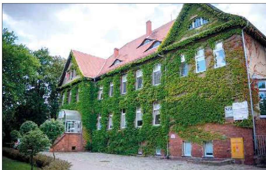
Budynek dawnego Publicznego Szpitala Powiatowego w Koźminie Wlkp. Zdjęcie współczesne.