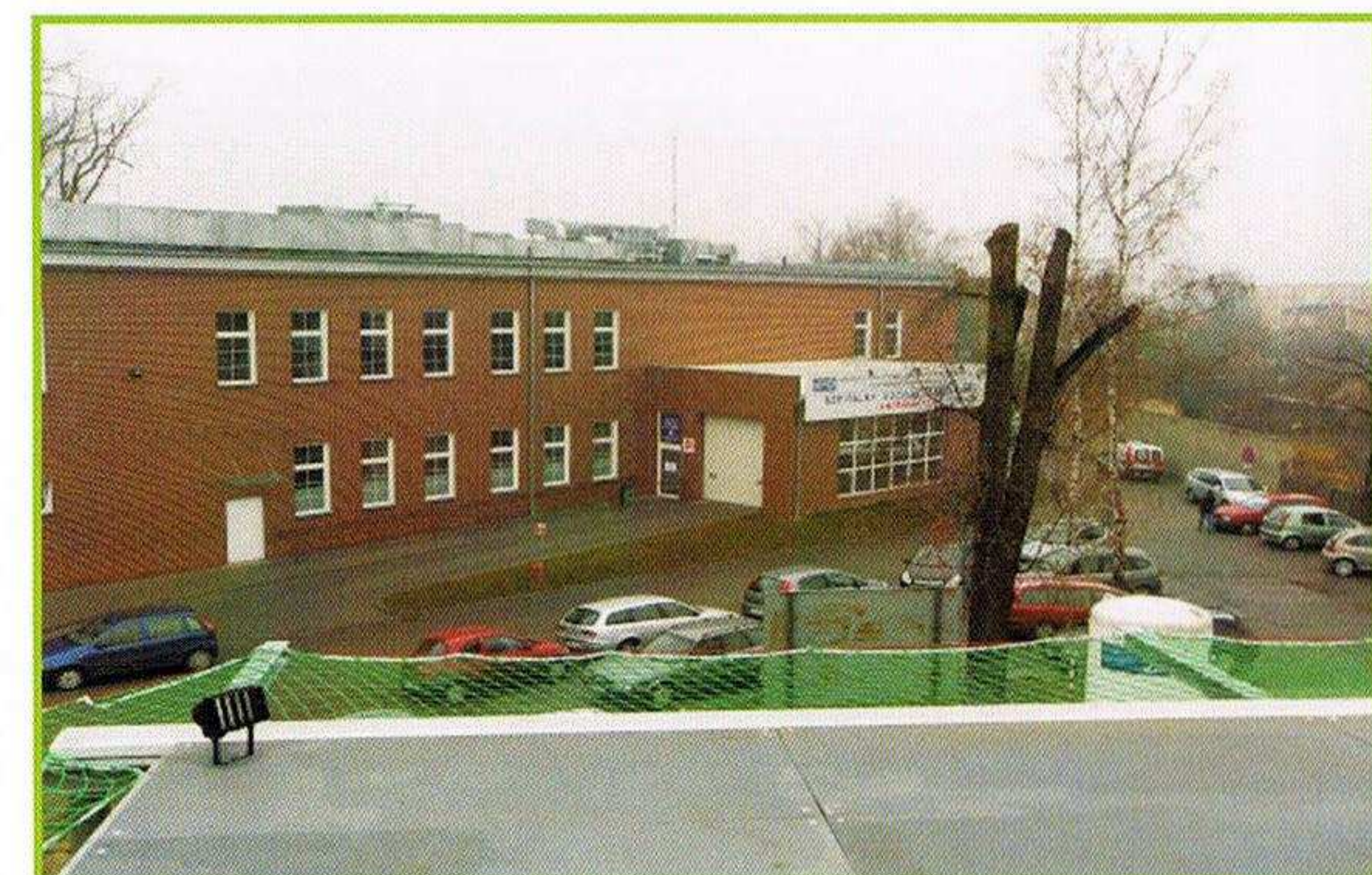
Widok z płyty lądowiska na SOR

Zrealizowana inwestycja pozwoli spełnić obligatoryjnie obowiązujące od 1 stycznia 2015 roku wymogi prawne dla szpitalnych oddziałów ratunkowych.