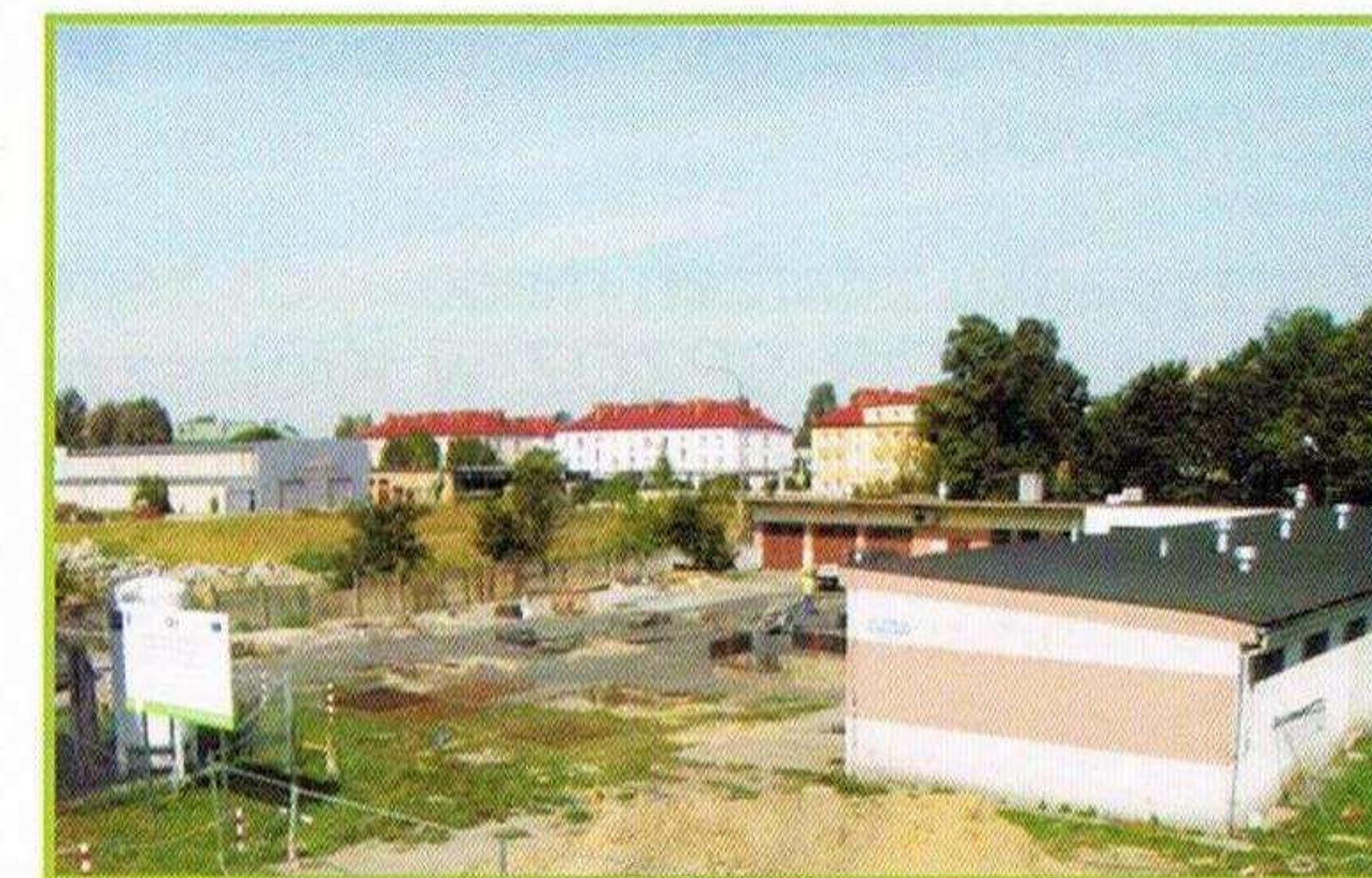
kwiecień 2012 r.