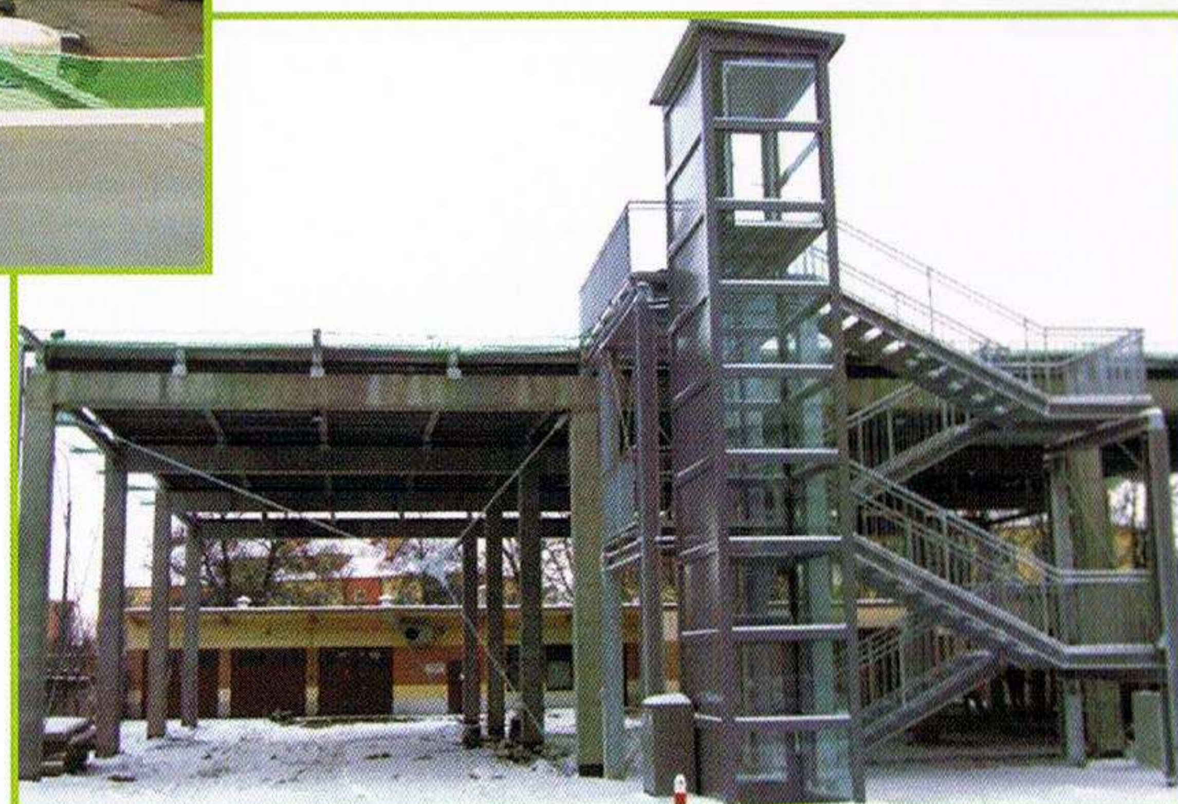
Platforma lądowiska oraz winda i schody służące komunikacji pionowej