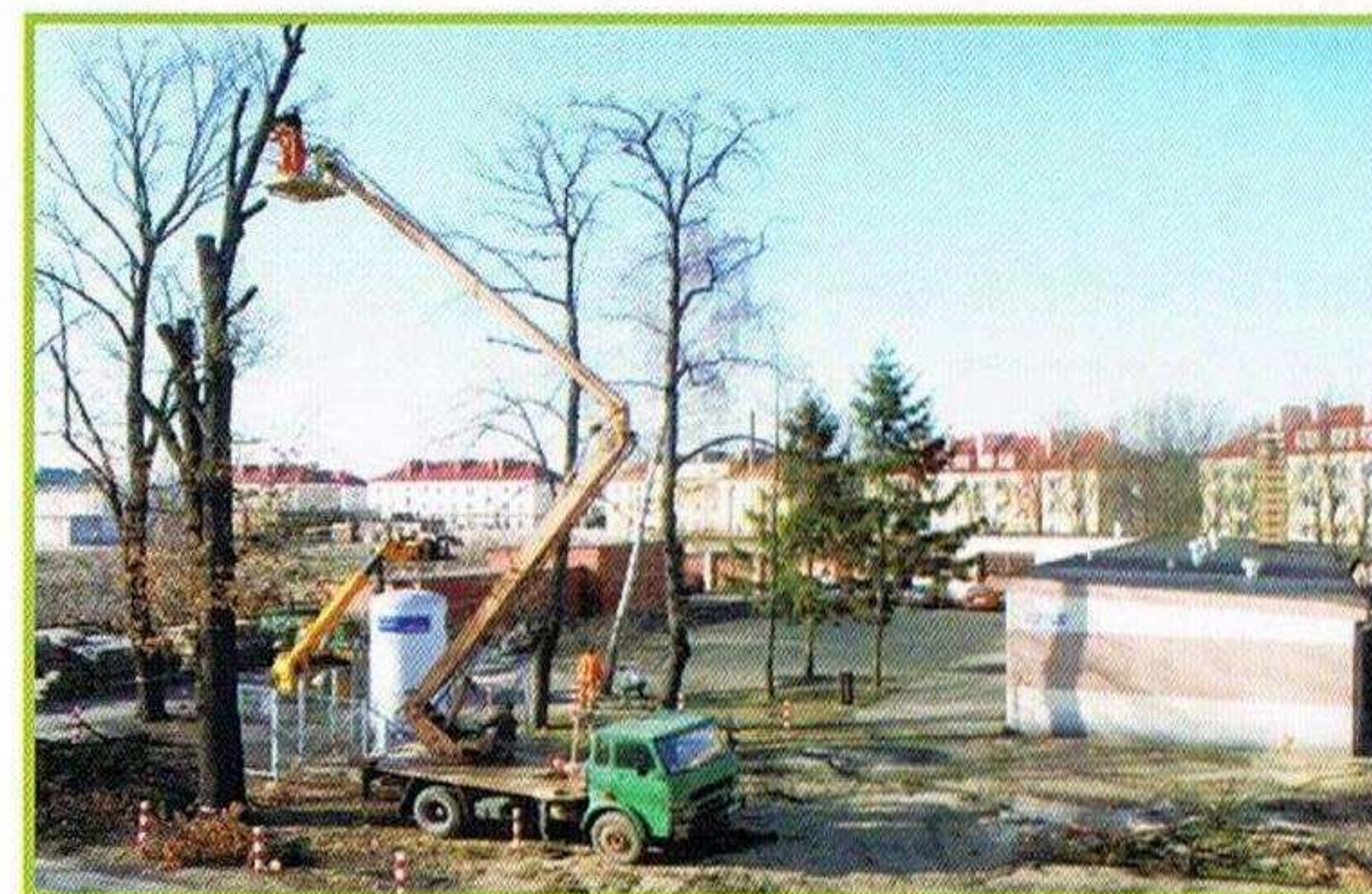
kwiecień 2012 r.